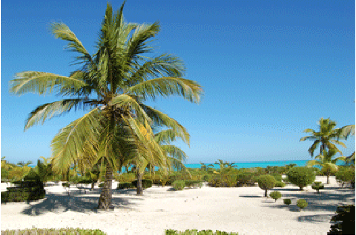
Von der Villa Bahr: Paradiesischer Ausblick auf Meer, Strand und Palmen